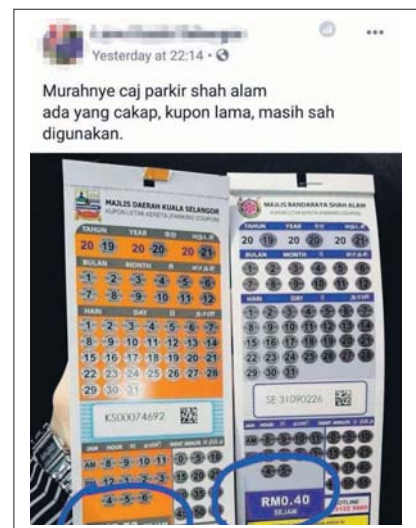
Tular di Facebook perbandingan caj kupon parkir berbayar antara MDKS dan MBSA semalam.

Noh berkata, beliau hairan mengapa tempat tertentu seperti di Pasir Penambang tidak dikenakan caj parkir terbahit.