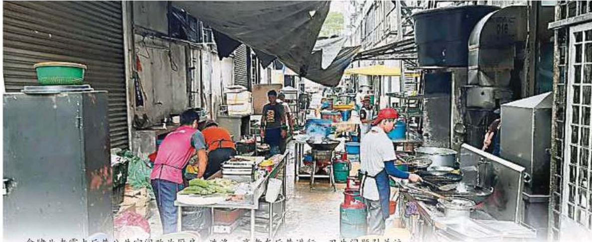
食肆業者霸占后巷公共空間改為廚房，洗滌、烹煮在后巷進行，衛生問題引關注。

Provided for client's internal research purposes only. May not be further copied, distributed, sold or published in any form without the prior consent of the copyright owner.