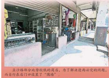
孟沙路部分地势較低的商店，为了解决逢雨必淹的问题，而自行在店门口设置了“围堵”。

我并不看好该工程可改善孟沙路的淹水问题，毕竟这么多年来，孟沙路逢雨必淹，先从马路上出现积水，再慢慢入侵店里，若是晚上开始下大雨，我也会感到十分担心，并且往下看。”