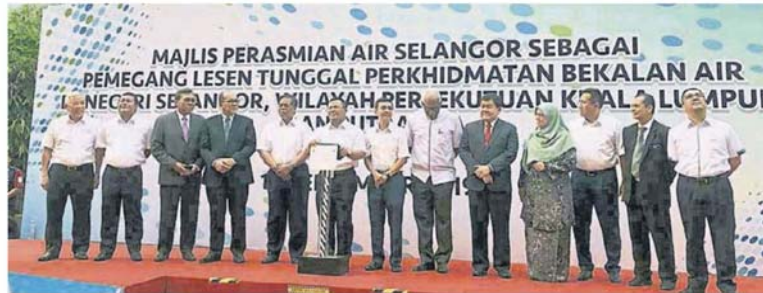
■阿米鲁丁（左6）主持雪州水供管理私人有限公司成为雪州独立水供执照持有者仪式。左6起为苏海米和国家水务委员会主席查尔斯。

（吉隆坡10日讯）雪州大臣阿米鲁丁宣布，雪州水供管理私人有限公司（Air Selangor）将从本月13日起，成为雪州独立水供执照持有者，终止持续10年的重组水供计划拉锯战，同时不排除重新检讨水费。他说，随著雪州水供管理私人有限公司在今年收购雪河公司（Splash），终于为这进行了10年的重组雪州水供计划画上完美的句号。他指出，收购雪州水河的最后价格是23亿5000万令吉，有关收购价是获得雪州水河、中央政府以及独立估价师核准的。“之前是20亿令吉，25亿5000万令吉是最后价格。”阿米鲁丁今日主持雪州水供管理私人有限公司成为雪州独立水供执照持有者仪式后受询及会否调涨水费时，阿米鲁丁