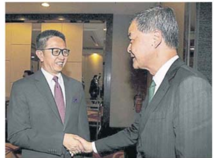
邓章钦 (左) 与抵达现场的梁振英握手寒暄。

“我们一向取得不俗的国内生产总值增长率，有关数据不仅傲视亚洲地区，也是世界之最，我们呼吁其他国家能尾随采用自由贸易经济的体制。”