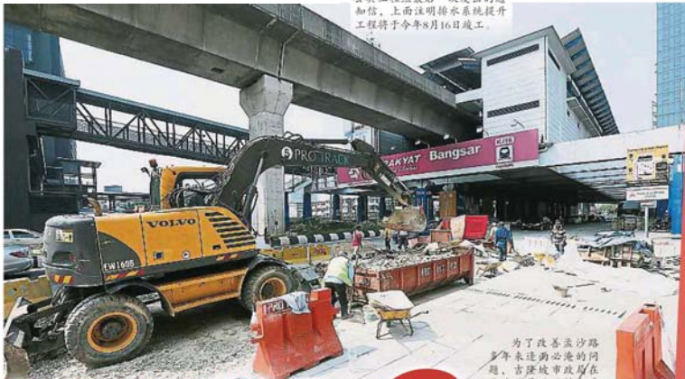
为了改善孟沙路近年来连雨必淹的问题，吉隆坡市政局在孟沙路展开了排水系统提升工程。