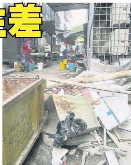
■与垃圾堆和垃圾槽“和平共处”的户外厨房。