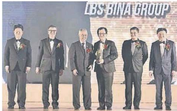
■最高元首苏丹阿都拉陛下 (左3) 颁发卓越企业领导人物奖予林福成 (右3)。左起为中国驻马特命全权大使白天、林福山；右起为福联会署理总会会长陈康益及经济事务部长阿兹敏阿里。

马来西亚福建联合会为表扬福建籍企业家在国家发展及经济领域作出的贡献，以及认可福建人在我国的创业精神和永续经营的领导人和企业，特别举