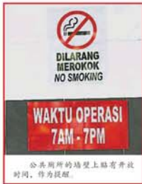
公共廁所的牆壁上貼有告示牌，作為提醒。