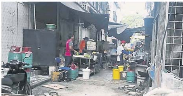
后巷是露天厨房外，也是石油气桶的屯放处。