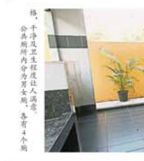
格，干淨及衛生程度讓人滿意。公共廁所內分為男女廁，各有4個隔格。