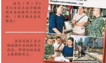
法米巡视了孟沙路的排水系统提升工程后，即将巡视内容上载到脸书上。