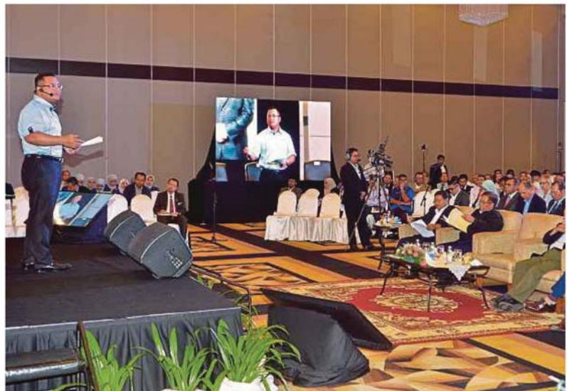
Amirudin berucap pada Dialog Bajet 2020 Pemberdayaan Ekonomi Ke Arah 'Selangor Maju Bersama' di Shah Alam, semalam.