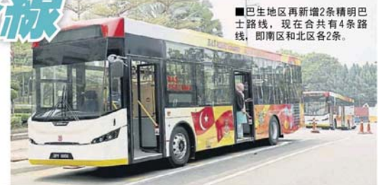
■巴生地区再新增2条精明巴士路线，现在合共有4条路线，即南区和北区各2条。