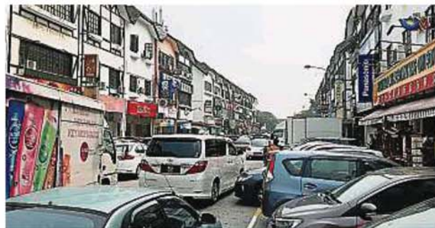
雙溪龍鎮因學生人口多，食肆越開越多，部分業者無視市議會條規占用后巷空間。

他不否認，市議會過去缺乏鮮明執法，沒有顯著的執法立場，使業者在霸占后巷的用途更大。