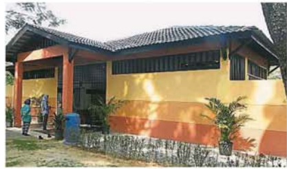
沙登南市政府證實，哥打哥文寧湖濱公園公共廁所并非因不讓民眾使用，而是事發當日出現少許問題，被迫提早關閉廁所。

提升，但却大門深鎖，沒開放給民眾使用，并质问是否只等列人民代议士前來跑步才開放使用，引起媒體及地方政府關注。