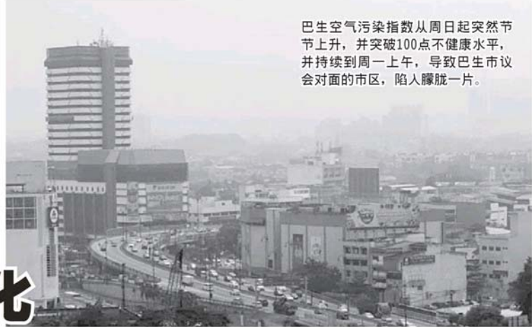
巴生空气污染指数从周日起突然节节上升，并突破100点不健康水平，并持续到周一上午，导致巴生市议会对面的市区，陷入朦胧一片。