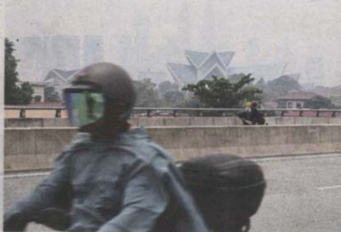
Kuala Lumpur's Petronas Twin Towers is shrouded in haze as seen from DUKE highway.

has advised people to take preventive steps to reduce the health effects caused by the haze.