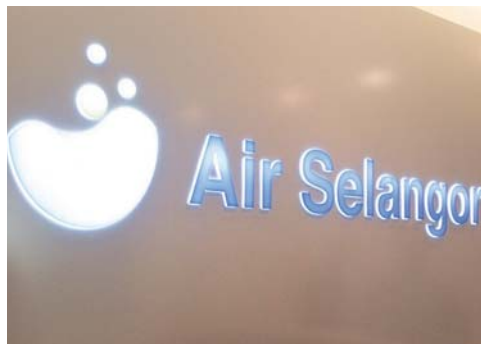
Logo baharu Air Selangor.

Ia ditubuhkan untuk menyediakan perkhidmatan air secara holistik di negeri Selangor, Wilayah Persekutuan Kuala Lumpur dan Putrajaya.