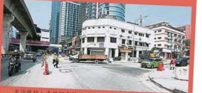
孟沙路转入冷格阿都拉路的路口被路障阻挡着，导致轿车无法驶入冷格阿都拉路。