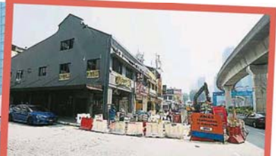
孟沙路的排水系统提升工程已进行了2年半，导致商家生意惨淡，转角处（灰色建筑）的餐厅也已搬迁。