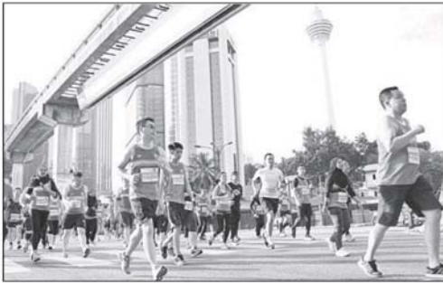
国内马拉松赛主办方强调，是否取消今年9月中至9月尾的马拉松赛事还言之过早，一切视赛事当天的空污情况而定。

Provided for client's internal research purposes only. May not be further copied, distributed, sold or published in any form without the prior consent of the copyright owner.