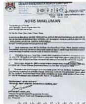
吉隆坡市政局城市交通及公共工程组最后一次发出的通知信，上面注明排水系统提升工程将于今年8月16日竣工。